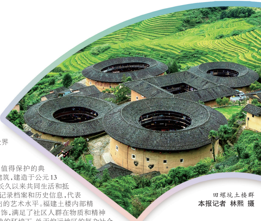
田螺坑土楼群

福建土楼是中国东南山区土楼中最出色的代表和最值得保护的典范。这种拥有高大体量、精湛建造技艺和完善防御体系的建筑,建造于公元13至20世纪,坐落于肥沃的深山峡谷之中,是一个社区族群长期以来共同生活和抵御侵害的居住传统的独特见证。福建土楼及其相关的各种记录档案和历史信息,代表了7个多世纪以来夯土建筑技艺的出现、创新、发展和杰出的艺术水平。福建土楼内部精细地划分为不同的功能单元,其中一些具有精美的外部装饰,满足了社区人群在物质和精神双方面的需求,并以一种独特的方式反映了在面临潜在威胁的环境下,处于偏远地区的复杂社会组织的一种发展模式。大量的土楼建筑和它们所处环境之间的关系,显示了风水观念,以及建筑与环境和谐统一的理念。