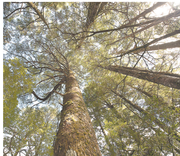
武夷山国家公园内,林木高大。

武夷山脉是中国东南部最负盛名的生物多样性保护区,也是大量古代孑遗植物的避难所,其中许多生物为中国所独有。九曲溪两岸峡谷秀美,寺院庙宇众多,但其中也有不少早已成为废墟。该地区为宋代理学的发展和传播提供了良好的地理环境,自11世纪以来,理学对东亚地区文化产生了相当深刻的影响。公元前1世纪时,闽越国在城村附近建立了一处较大的行政首府,厚重坚实的围墙环绕四周,极具考古价值。