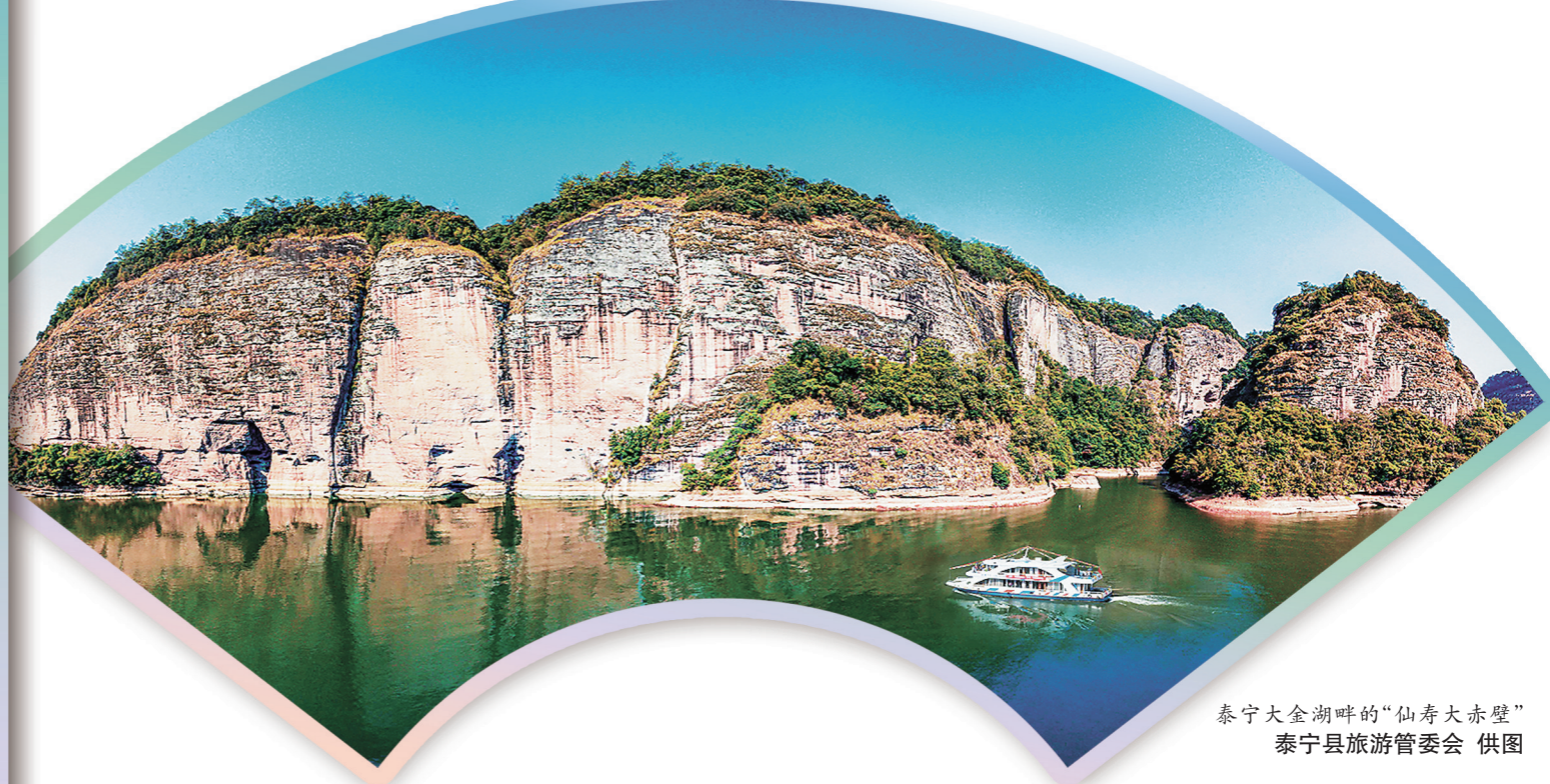
泰宁大金湖畔的“仙寿大赤壁”