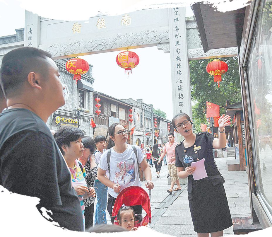
一片三坊七巷,半部中国近代史。