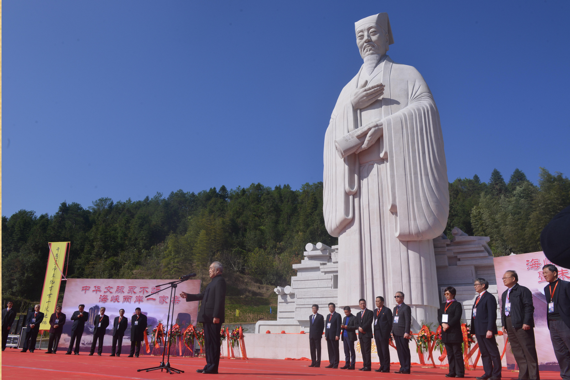
2016年12月17日，武夷山市朱子故里“海峡两岸交流基地”授牌