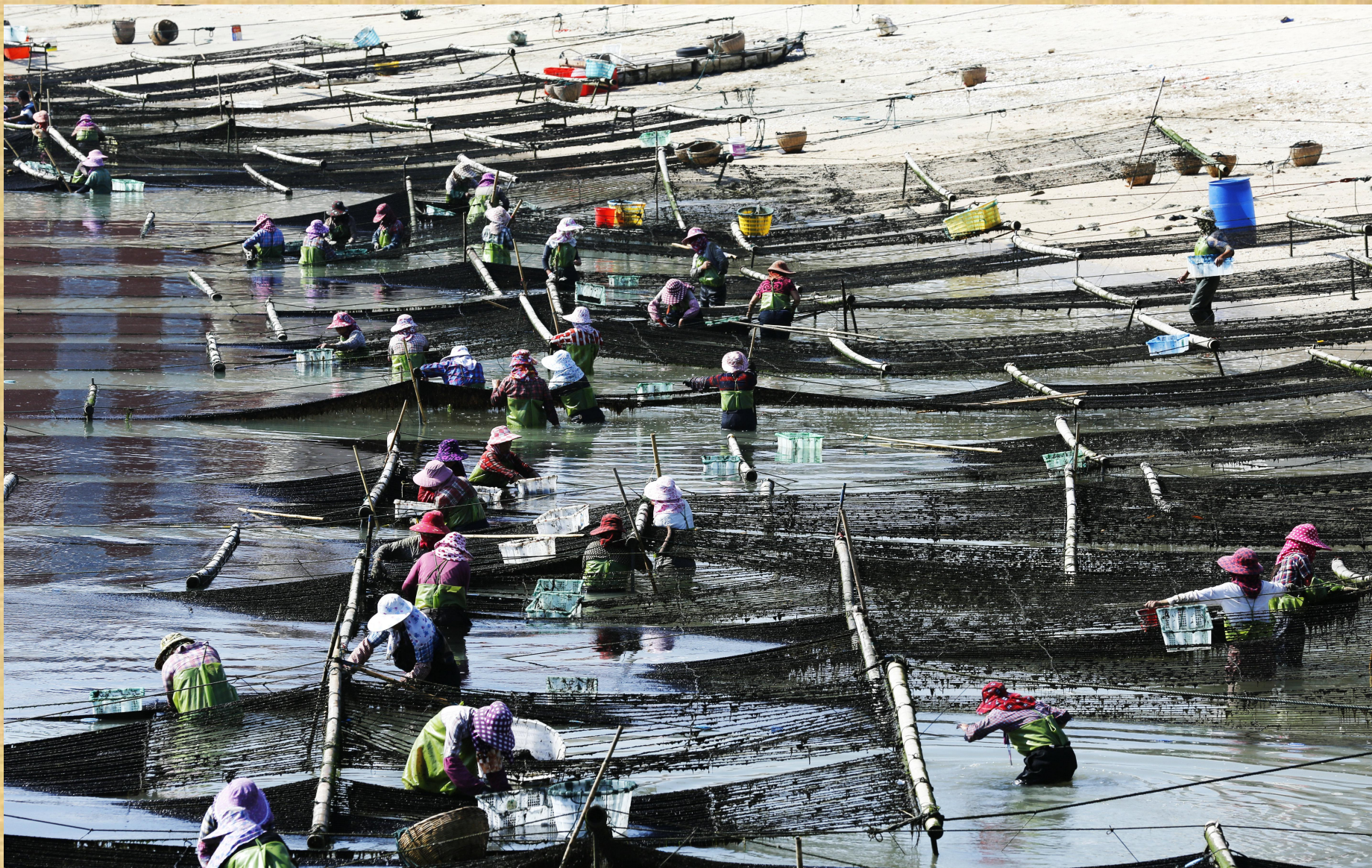
2016年，莆田山亭镇蒋山村发展“一村一品”特色养殖，图为紫菜养殖现场