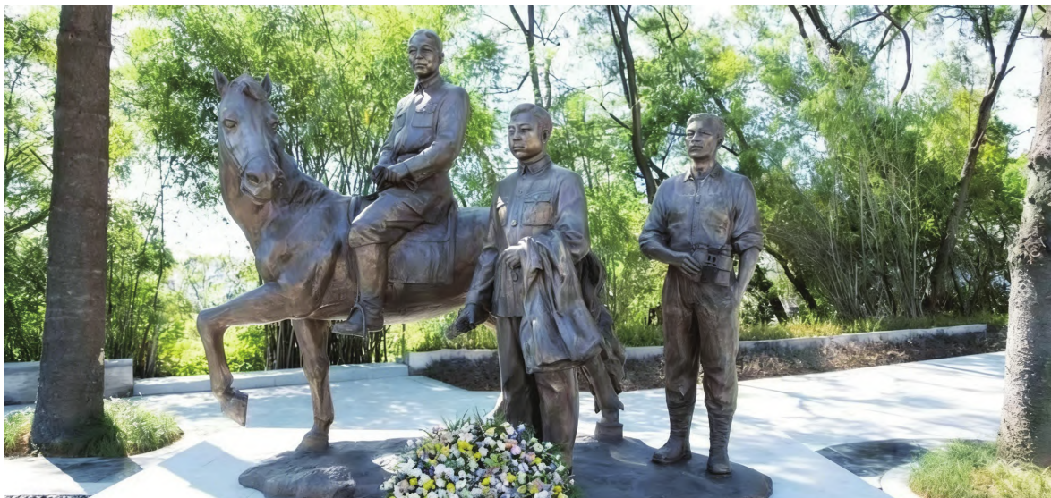
位于福州市革命英烈纪念园的《统一之愿》雕塑